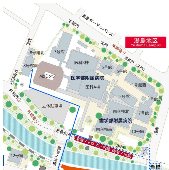
図1 東京医科歯科大学 8号館南へのアクセスマップ

要旨： クライオ電子顕微鏡を用いた単粒子解析法の構造解析例の話題提供。AAA (ATPase associated with various activities) ファミリータンパク質は、原核から真核生物に至るまで存在し、保存されたモジュールから構成されると共に生体内での多種多様なプロセスに関わっている。そのうちのひとつである Mdn1 は真核生物において 60S サブユニットの成熟ステップに関わるリボソーム非構成因子であり、そのドメイン配列の類似性からモータータンパク質ダイニンと同様の power-stroke motion を伴う機能を持つと推察されていた。全長 Mdn1 の構造からは、C 末側リンカードメインは大きく曲がることなく N 末側の AAA ドメインから遠く伸びていることが示された。また、特異的阻害剤 Rbin-1 存在下での構造から、最 C 末端の基質結合ドメインが ATP 加水分解依存的に AAA ドメイン上へドッキングすることも明らかになった。これらのことから、Mdn1 においては AAA ドメイン自身の構造変化により、pre-60S 粒子への結合と共に pre-60S 粒子上にある標的基質の脱離を直接調節していることが示唆された。